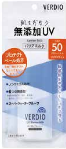
「ベルディオUVバリアミルク」 80g 1320円(税込)

「ベルディオUVバリアミルク」(SPF50/PA++++/UV耐水性★)は、ノンケミカル処方 ※ で無添加(紫外線吸収剤・香料・着色料・鉱物油・パラベン・エタノール無配合)の日焼け止めです。敏感肌の方やお子さまのデリケートなお肌を、強烈な紫外線からやさしくしっかり守ります。